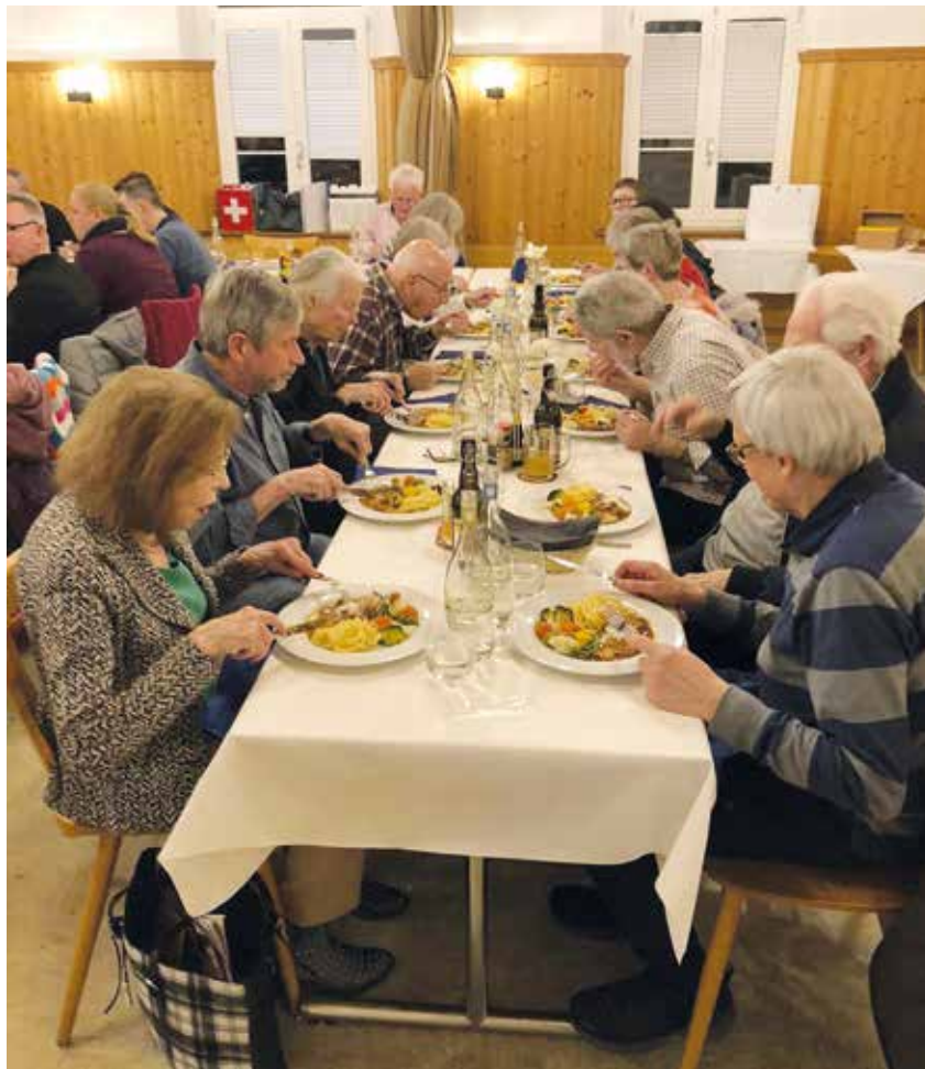
Einstimmigkeit herrschte an der Generalversammlung der TCS-Regionalgruppe Kreuzlingen im Gasthaus Sonne in Lengwil.

Sämtliche Traktanden, über die abgestimmt werden musste, wurden einstimmig angenommen. Die positiven Zahlen, die von Kassierin Franziska Staub präsentiert