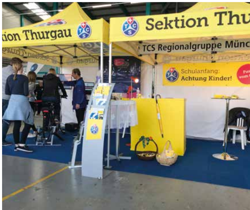
Die TCS-Regionalgruppe Münchwilen war dieses Jahr an der Gewerbeausstellung «Schaufenster Balterswil/Bichelsee» vertreten.

Der TCS hat heute viele neue Angebote, wie z.B. Velo- und Haushaltsgeräteversicherung, Gebäuderechtsschutz, etc. Der Erfolg zeigt sich auch in der Mitgliederzahl, hat sich diese in unserer Regionalgruppe seit dem letzten Jahr doch um 2.7 Prozent